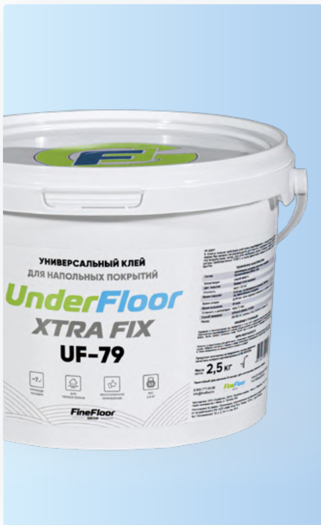
XTRA FIX (UF-79) универсальный клей