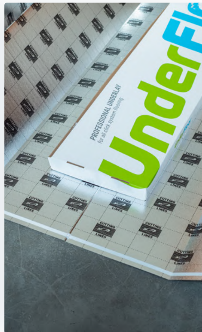
SILVER LINE подложка