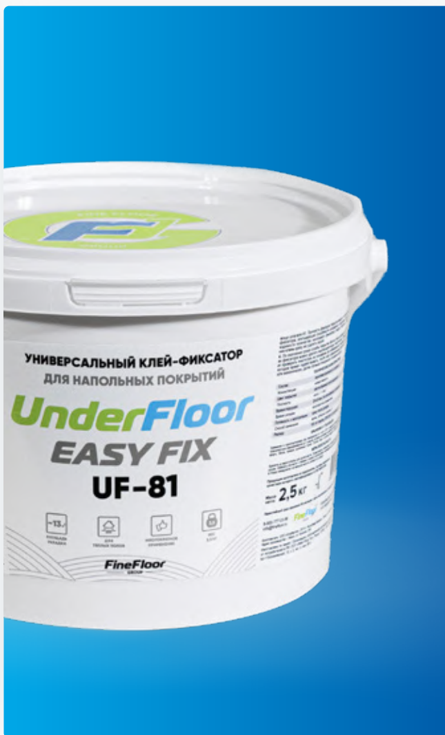
EASY FIX (UF-81) универсальный клей-фиксатор