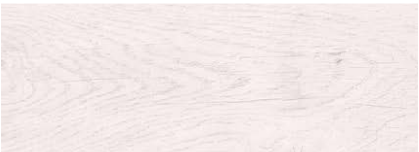
ДУБ НЕАПОЛЬ LE8-08