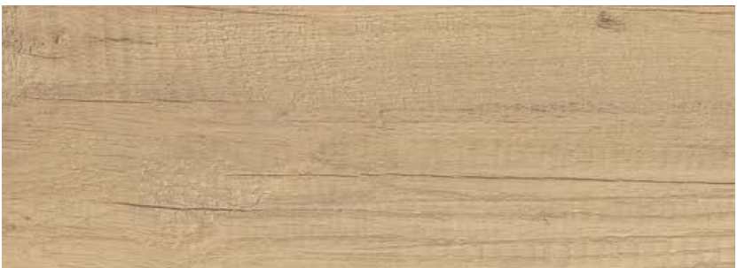
ДУБ АРАБИКА LE8-02