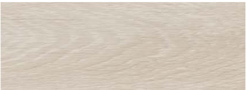
ДУБ СИДАМО LE8-11