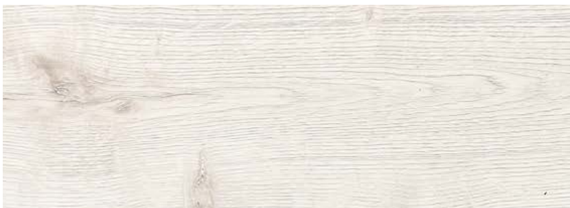
ДУБ МОНРО LE8-07