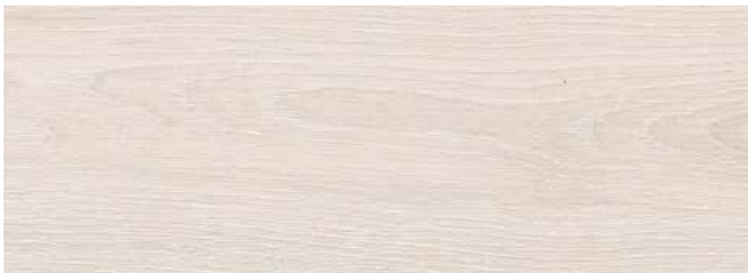
ДУБ АЛУРА LE8-01