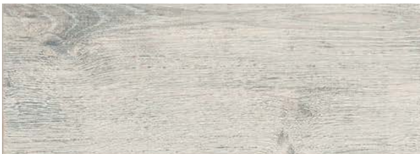
ДУБ ПАЛЕРМО LE8-10