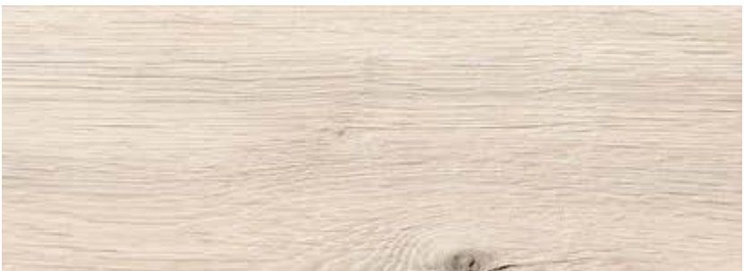
ДУБ КОНА LE8-05