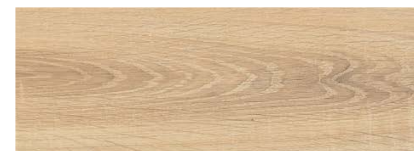
ДУБ ЭРЗИ LE10-14