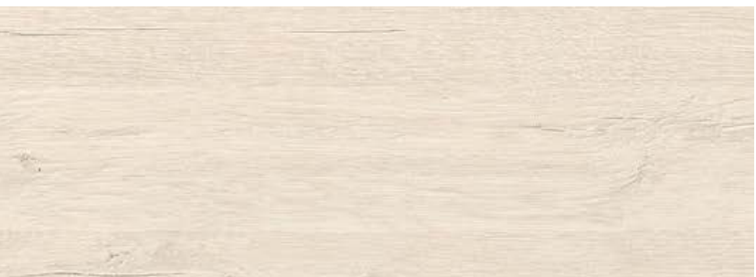
ДУБ ПАКАС LE8-09