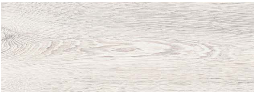
ДУБ КОЛАМБИЯ LE8-04