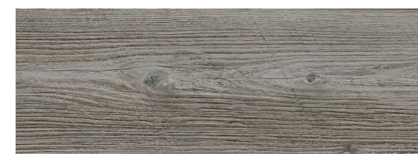
ДУБ УИЛ LE10-13