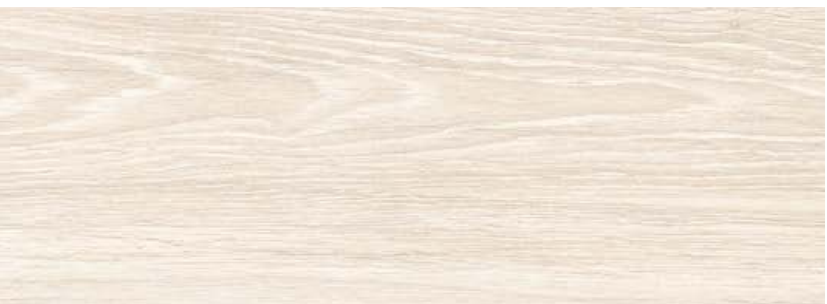
ДУБ ЭЛЬБА LE8-15