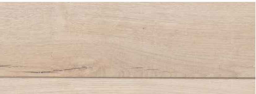
ДУБ МАРСЕЛЬ LE8-06