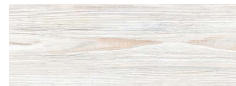
ДУБ РИОНИ LE10-16