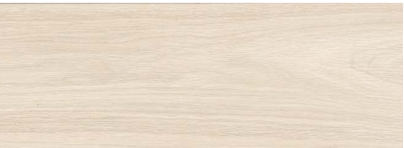
ДУБ БРЮТ LE8-03