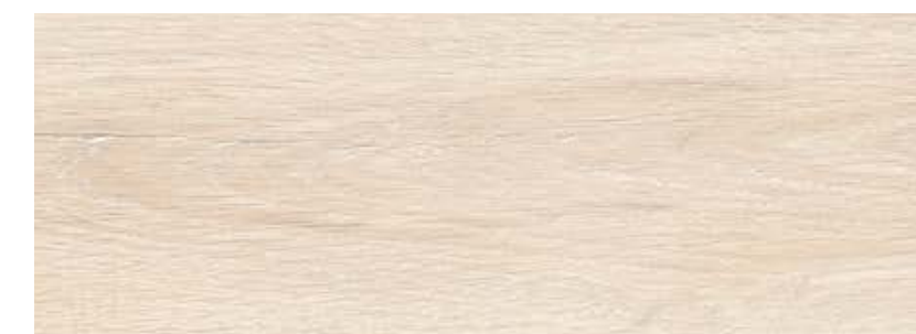
ДУБ АЗАУ LE10-12